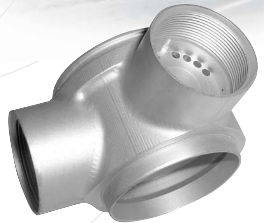
Beispiel aus dem Motorsport (aus dem Vollen gefertigt)

„Je größer die Schwierigkeit, die man überwand, desto größer der Sieg.“