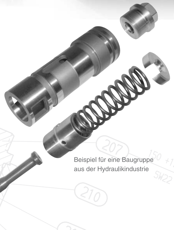
Beispiel für eine Baugruppe aus der Hydraulikindustrie

Als Rundum-Partner begleiten wir Ihre Idee während des gesamten Fertigungsprozesses. Der erste und entscheidende Bearbeitungsschritt auf dem Weg vom Plan zum Werkstück findet im Kopf statt. Vergessen Sie nicht, dass er im Preis inbegriffen ist.